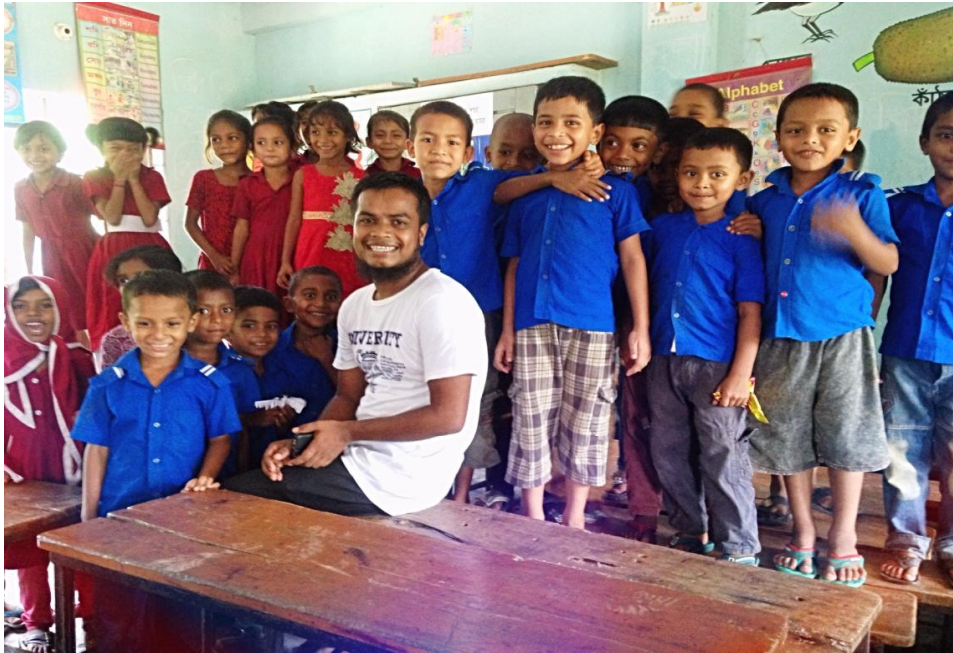
স্থানঃ উত্তর ধলিয়া সরকারী প্রাথমিক বিদ্যালয়।

উত্তর ধলিয়া সরকারী প্রাথমিক বিদ্যালয়ের শিক্ষার্থীদের জুনিয়র একাউন্ট চালু করার জন্য উৎসাহ প্রদানে গিয়ে শিক্ষার্থীদের সাথে।