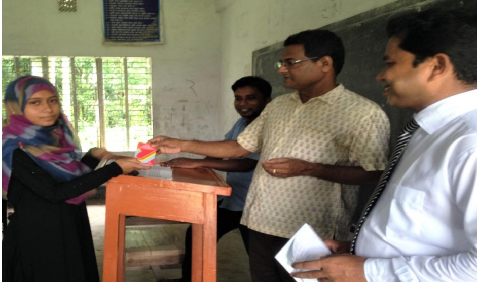
স্থানঃ বাগেরহাট উচ্চ বিদ্যালয়।

বাগেরহাট এজেন্ট ব্যাংকিং সেন্টারের ইনচার্জ এর পক্ষ থেকে এস,এস,সি পরীক্ষার্থীদের ডিকশনারী উপহার। উপস্থিত ছিলেন বাগেরহাট উচ্চ বিদ্যালয়ের প্রধান শিক্ষক, সহকারী শিক্ষক এবং পরীক্ষার্থীরা।