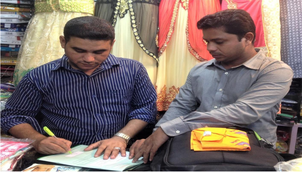
স্থানঃ ফেনী নিউ মার্কেট।

ব্যবসায়ীদের হিসাব চালু করা এবং বাগেরহাট এজেন্ট ব্যাংকিং সেন্টারে লেনদেন করার জন্য উৎসাহী করতে ব্যবসায়ীর কাছে যাওয়া অতঃপর তথ্য সংগ্রহ করা। বাগেরহাট এজেন্ট ব্যাংকিং সেন্টারের ইনচার্জ এবং ব্যবসায়ীবৃন্দ।