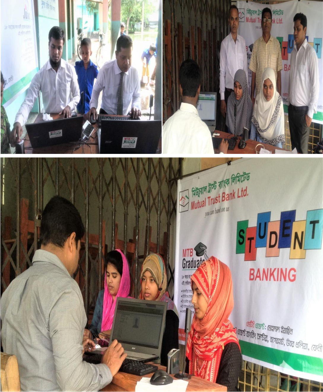
স্থানঃ বাগেরহাট উচ্চ বিদ্যালয়।

আঠারো বছরের কম বয়সী শিক্ষার্থীদের জন্য এমটিবি'র রয়েছে এমটিবি জুনিয়র একাউন্ট। একাউন্ট চালু করার জন্য শিক্ষার্থীদের ফিংগারপ্রিন্ট নেয়ার স্থির চিত্র। উপস্থিত ছিলেন বাগেরহাট উচ্চ বিদ্যালয়ের প্রধান শিক্ষক, এমটিবি এজেন্ট ব্যাংকিং সেন্টারের এজেন্ট ও ইনচার্জ এবং বিদ্যালয়ের শিক্ষার্থীরা।