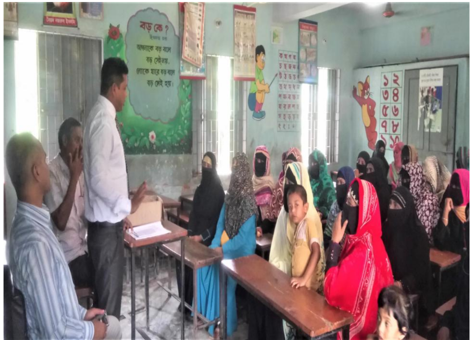
স্থানঃ উত্তর ধলিয়া সরকারী প্রাথমিক বিদ্যালয়।